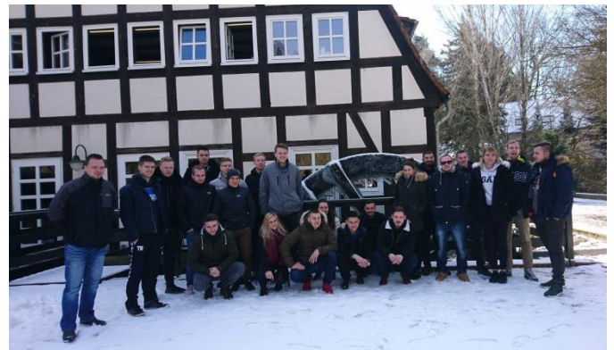
Die angehenden Groß- und Außenhändler des Intensivtrainings vom 19. bis 23.03.2018 in Bad Belzig.

Danke für die tolle Lernwoche und das angenehme Lernklima. Man kann sich keine bessere Prüfungsvorbereitung vorstellen. An beide Dozentinnen und das ganze Hotelteam: ein großes Lob und DANKE!“