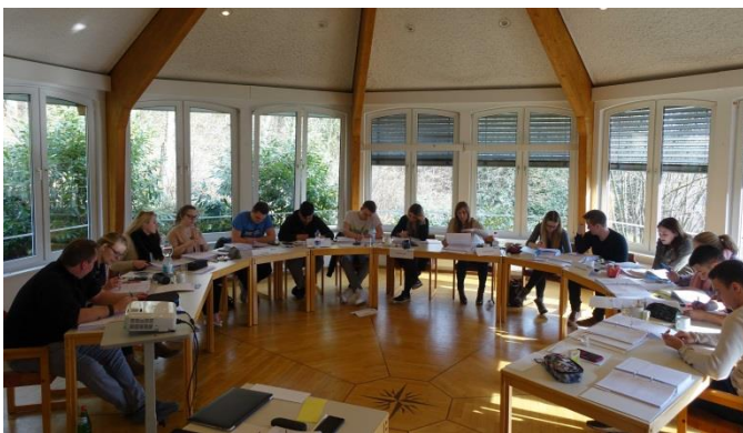
Die Teilnehmer des Großhändlerkurses FG03 vom 05. bis 09.03.2018 in Goslar.

Zusammenfassend lässt sich sagen, dass die Seminarwoche ein voller Erfolg war und wir sehr gut auf die Abschlussprüfung vorbereitet wurden.“