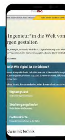
App think ING. (ab 2. HJ 2023)