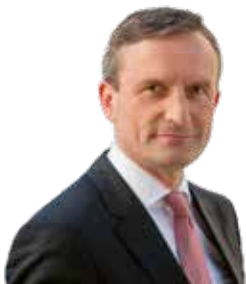
Schirmherr des Lesefestes Thomas Geisel Oberbürgermeister der Landeshauptstadt Düsseldorf