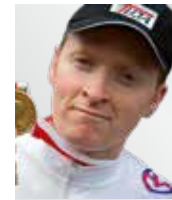
Joey Kelly Extremsportler