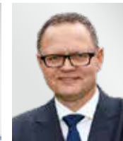
Ulrich „Ulli“ Potofski Sportmoderator