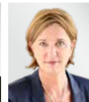
Yvonne Gebauer Schulministerin NRW