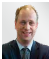
Dr. Joachim Stamp Familienminister NRW