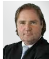
Lutz Lienenkämper Finanzminister NRW