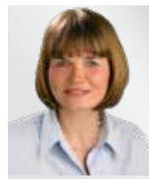
Klaudia Zepuntke Bürgermeisterin